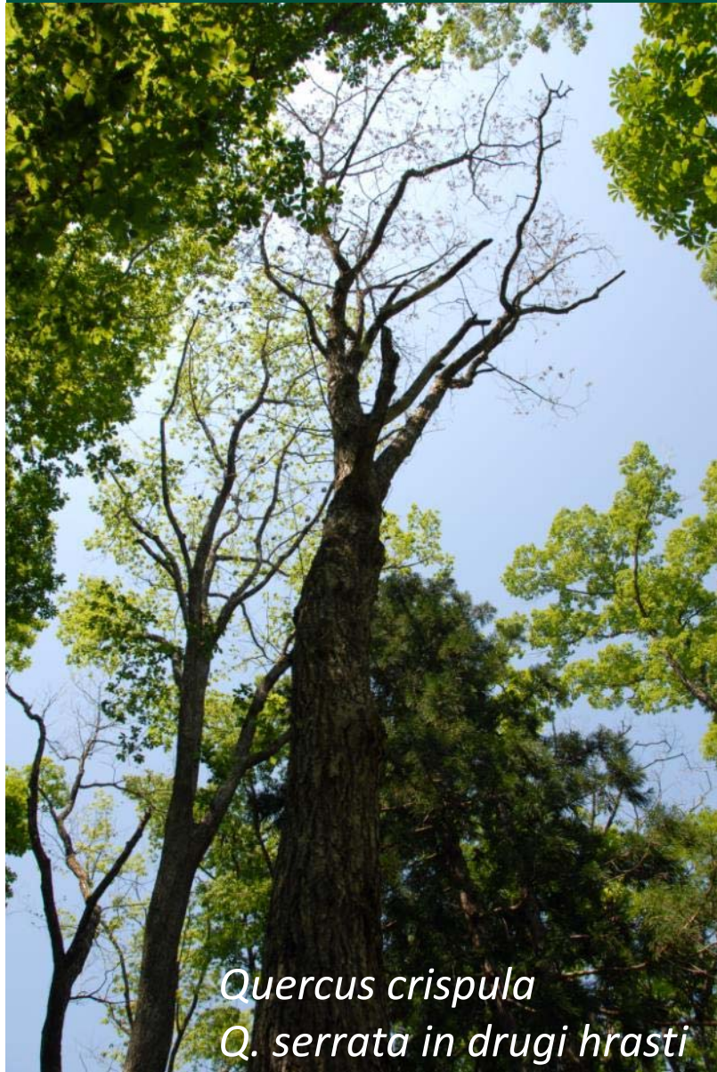
Quercus crispula Q. serrata in drugi hrasti