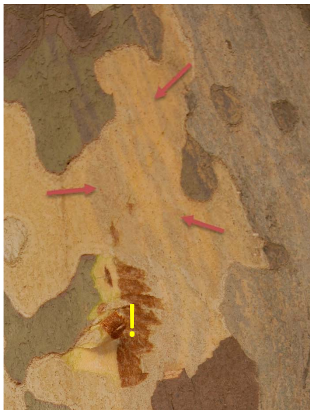
Slika 1: Temnejše lise na površini žive skorje platane nakazujejo okužbo s platanovim obarvanim rakom (puščice), če skorjo zarezemo opazimo, da je rdeče rjava in odmrla (klikaj) (Foto D. Jurc, GIS)

Na leto se razraste v lesu 2 do 2,5 m v dolžino. Obenem, ko se razrašča v lesu, prodira tudi po kambiju in skorji in ju uničuje (slika 1). Bolezen ima torej značilnosti traheomikoze in tudi rakavega obolenja skorje. Gliva se lahko širi na sosednje platane z zraščeni koreninami (slika 3). Okuženo drevo odmre v nekaj letih.