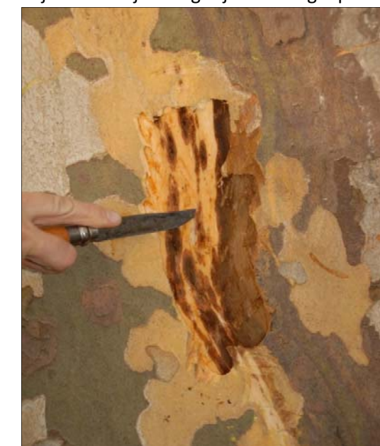
Slika 2: Pod okuženo skorjo platane so v lesu temne lise okuženega lesa

tanko steno. Tretja oblika trosov so klamidospore (tudi nespolni trosi), ki nastajajo v okuženem lesu. Imajo debelo steno in so izjemno dolgožive (več let) ter odporne na neugodne razmere okolja. Lepljive askospore in konidiji so prilagojeni na prenos z vodnimi kapljicami in jih prenašajo številni hrošči, ki živijo v lesu. Vsak delček okuženega platanovega lesa (npr. žaganje ali črvina) pa vsebuje tudi klamidospore, ki jih prenašajo žuželke, veter in predvsem človek, ko obžaguje obolele platane ali prenaša njihov okužen les. Gliva prodre v drevo le skozi rane, uničuje celice skorje in kambija. Podgobje nato naglo prerašča les, kjer povzroči zamašitev celic za prevajanje vode.