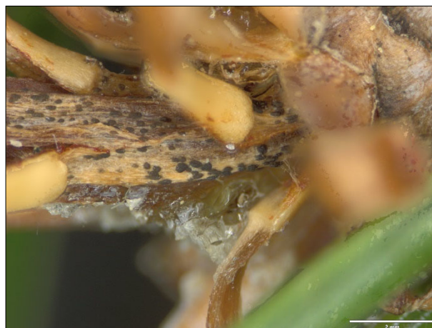
Slika 2: Na osnovi odmrlih poganjkov in na iglicah so se pojavljala nespolna trosišča (piknidiji) glive Sirococcus conigenus (foto. N. Ogris)