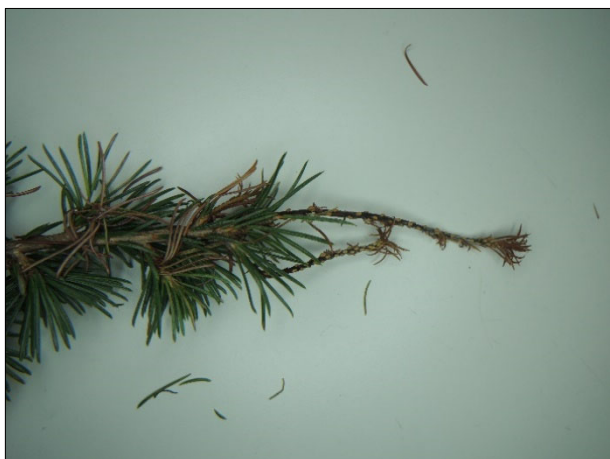
Slika 1: Libanonski cedri so se sušili glavni in stranski poganjki na vejah

Določitev glive do vrste smo izvedli po naslednjem postopku: najprej smo reisolirali glivo iz roba nekroze odmirajočih poganjkov v čisto kulturo na gojišču PDA. Potem smo vrsto določili na osnovi sekvence ITS rDNA. Določili smo vrsto S. conigenus in s tem smo ovrgli sum na S. tsugae .