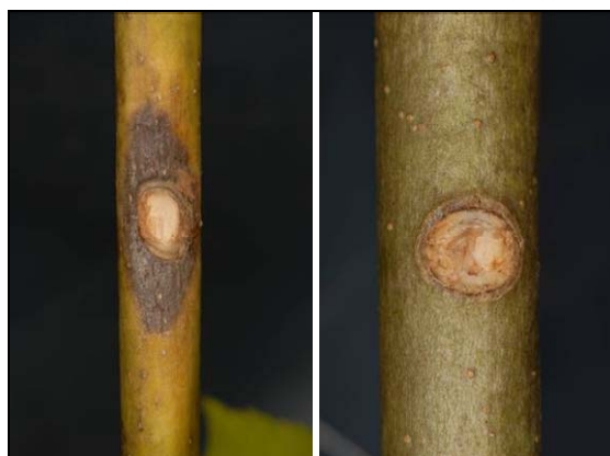
Slika 2: (slika levo) Nekroza, ki jo povzroči gliva Chalara fraxinea na letošnjih poganjkih velikega jesena 4 tedne po inkulaciji; (slika desno) zaceljena kontrola