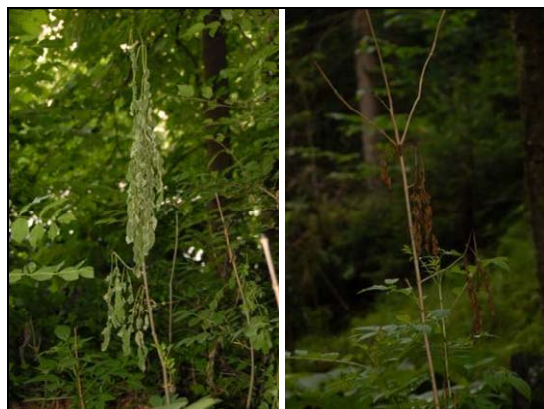
Slika 4: Najbolj pogost simptom jesenovega ožiga - venenje listov in sušenje poganjkov