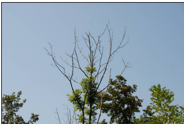
Slika 3: Močno prizadeta krošnja velikega jesena najverjetneje zaradi jesenovega ožiga