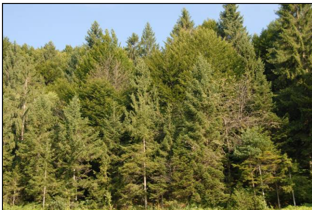
Slika 1: V sestoju od daleč opazimo drevesa brez listja. Ali so se posušila?

Zatiranje bolezni v gozdu ni potrebno, saj je pojav bolezni popolnoma odvisen od vlažnega vremena. Če se bolezen pojavlja leto za letom na istem mestu, lahko pojav bolezni nekoliko omilimo z grabljenjem odpadlih listov pozno poleti ali jeseni. Zaradi zmanjšane primarne produkcije je nekoliko prizadet prirastek v letu, ko je drevesu prekmalu odpadlo listje. Češnjeva listna pegavost je izključno bolezen listov. Zaradi te bolezni se češnji ne posušijo poganjki ali veje. Spomladi se bo češnja ponovno normalno olistala.