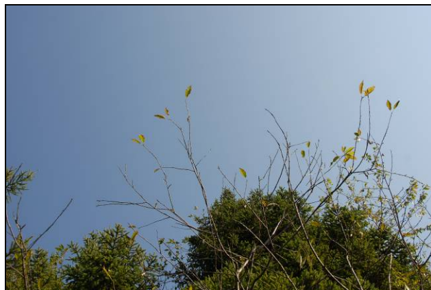
Slika 2: Od blizu vidimo, da gre za divjo češnjo, ki je že sredi julija skoraj popolnoma brez listja