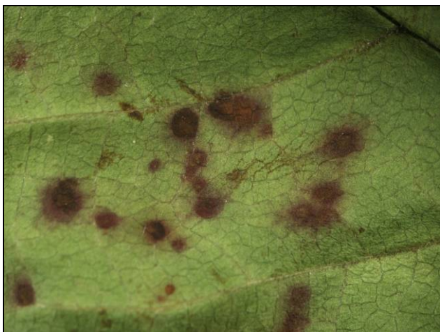
Slika 3: Vijolično-rdeče pege na zgornji strani lista so simptom za češnjevo listno pegavost