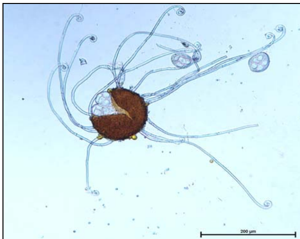
Slika 4: Kleistotecij s priveski iz katerega izhajajo aski z askosporami