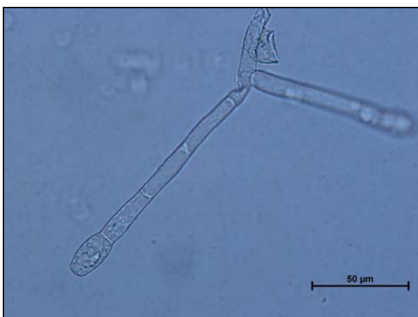
Slika 3: Trosonosec (konidiofor) na katerem nastajajo konidiji