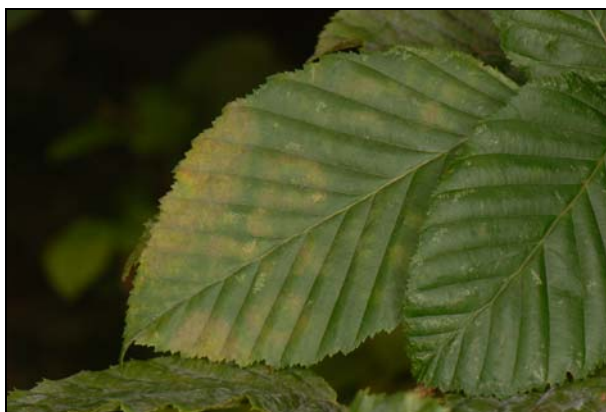
Slika 2: Klorotične lise na listih gabra