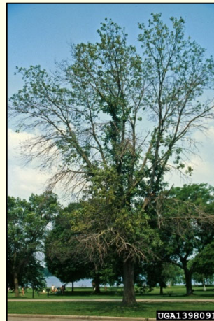
Slika 4: Sušenje vej zaradi napada drevesnega škodljivca (Foto: Steven Katovich, USDA Forest Service, Bugwood.org).