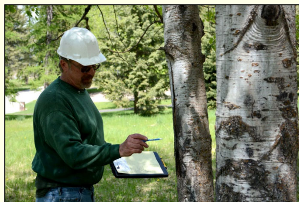
Slika 6: Arborist natančno pregleda drevo in oceni njegovo stanje.