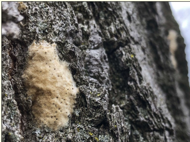
Slika 13: Jajčna masa gobarja ( Lymantria dispar ), katerega gošenice povzročajo defoliacijo (izgubo listov) dreves različnih vrst listavcev in imajo močno alergene dlačice.