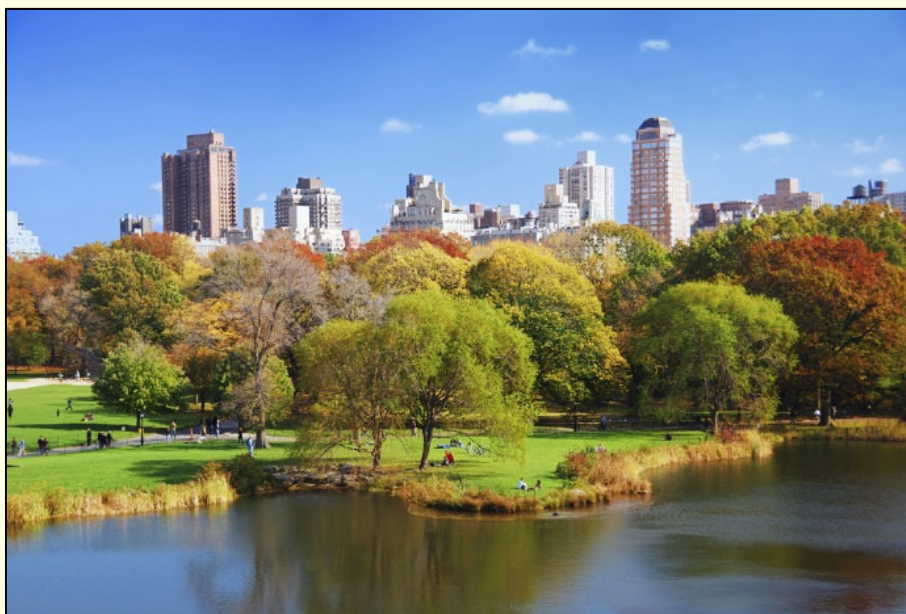
Slika 1: Drevesa v urbanem okolju ugodno vplivajo na življenje ljudi.

drevjem v urbanem okolju se ukvarja arboristika (ang.: arboriculture, nem.: Baumpflege), ki pomeni gojenje in raziskovanje lesnatih rastlin – ponavadi drevja. Arboristika je praviloma omejena na urbana območja in se osredotoča na posamezna drevesa. Vključuje izbiro in zasaditev, gnojenje in zalivanje ter ostalo redno oskrbo, zaščito pred abiotičnimi poškodbami, obvladovanje bolezni in škodljivcev, obrezovanje, oblikovanje, posek, ... skratka, stalno skrb za ohranjanje optimalnega zdravstvenega stanja posameznih lesnatih rastlin s ciljem njihovega dolgotrajnega ohranjanja v prostoru. Arboristika ni in nikakor ne sme biti zgolj slabo premišljeno obžigovanje in podiranje dreves! Z naraščajočo urbanizacijo postaja arboristika vse bolj pomembna panoga (Slika 2).