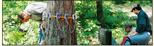
Slika 10: Arboristi za ocenjevanje stanja drevesa uporabljajo posebne naprave.