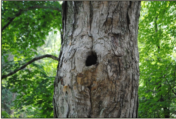
Slika 9: Vsakršne nepravilnosti na drevesu zahtevajo natančen pregled.