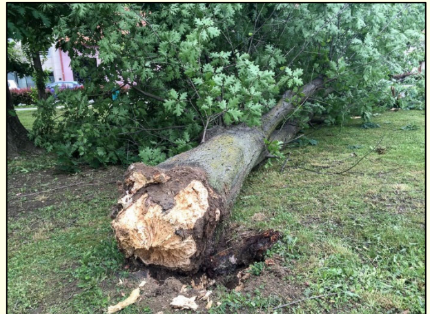
Slika 12: Sredi Murske Sobote se je zaradi trohnobe korenin podrl na videz povsem zdrav hrast.