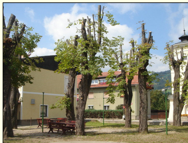
Slika 8: Nepravilno vzdrževana drevesa ne morejo opravljati svojih funkcij.