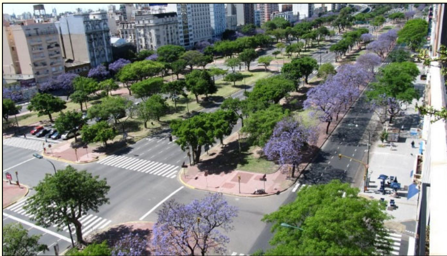
Slika 2: Z naraščajočo urbanizacijo postaja arboristika vse bolj pomembna.

V mnogih mestih rastejo mogočna stoletna stara drevesa, ki imajo veliko kulturno in naravno vrednost in dajejo mestom poseben pečat. Poleg tega, da so bila taka drevesa v stoletjih podvržena številnim negativnim vplivom, je s starostjo začela usihati tudi njihova vitalnost. Kljub mogočnemu videzu postajajo vse bolj dovzetna za bolezenske okužbe in napade škodljivcev. Na takih drevesih so pogoste deformacije in nepravilna rast, izvotlitve debla, pojavlja se odmiranje korenin, sušenje krošnje, lomljenje vej, ... (Slika 9)