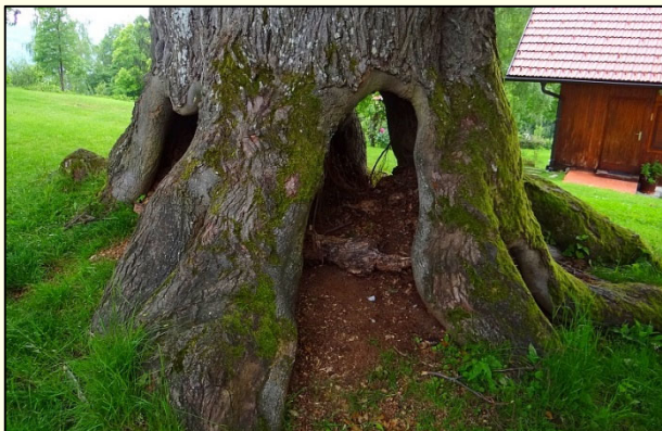
Slika 11: Zaradi obsežnih izvotlitev stara drevesa niso nujno manj stabilna.