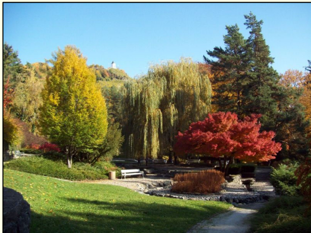
Slika 3: Estetsko urejen mestni park Maribor.

1 Gozdarski inštitut Slovenije, Večna pot 2, 1000 Ljubljana *andreja.kavcic@gozdis.si