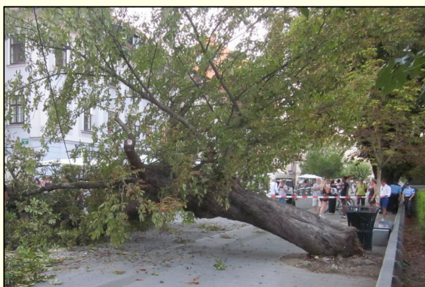
Slika 5: Padlo drevo v središču Ljubljane.