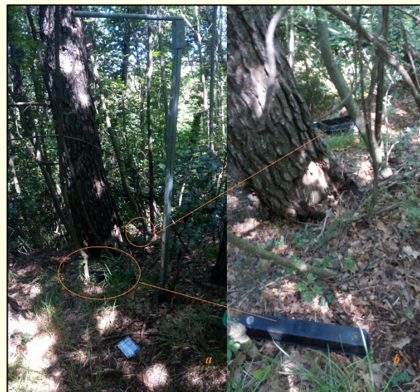
Slika 3: Razdrta (uničena) režasta past tipa Theysohn, namenjena za spremljanje vektorjev glive Fusarium circinatum , ki povzroča borov smolasti rak, je posledica vandalizma (a, b)