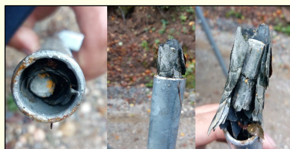
Slika 5: Prevoz slepih potnikov (v konkretni situaciji je sicer nedolžen primer prevoza čebel iz družine znosk (Hymenoptera, Megachilidae)) v votli kovinski konzoli (ogrodju), uporabljeni za namestitev pasti tipa Theysohn.