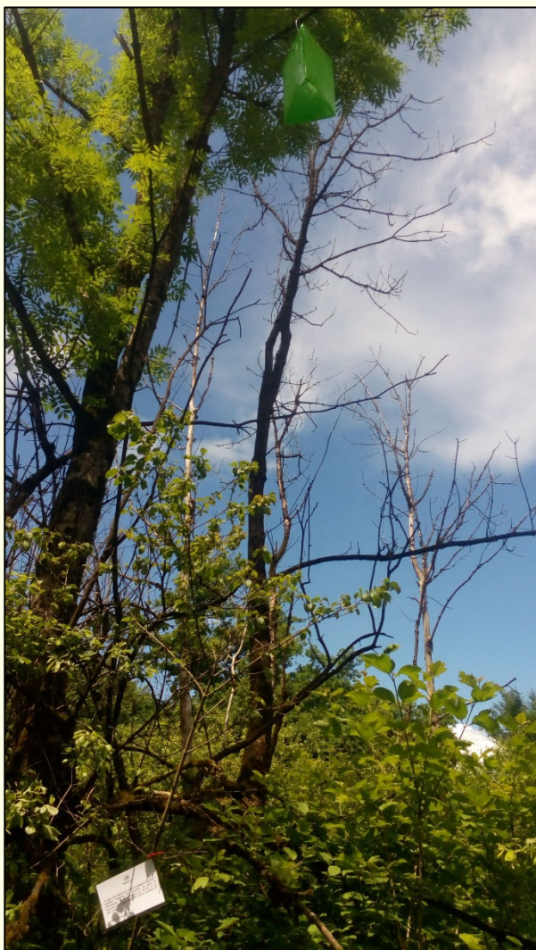
Slika 1: Prizmatična lepljiva past, opremljena z vabo in obešena v krošnjo jesena Fraxinus excelsior , je namenjena ugotavljanju navzočnosti jesenovega krasnika, ( Agrilus planipennis ). Past je opremljena z obvestilom, ki vsebuje informacijo o namenu postavitve, kontaktnimi podatki odgovorne osebe in logotipom GIS

determinaciji se jih pošlje naprej na Kmetijski inštitut Slovenije (KIS), kjer vektorje testirajo na prisotnost borove ogorčice. Kontrolne pasti za ugotavljanje navzočnosti neevropskih vrst kozličkov iz rodu Monochamus so opremljene z zaprto zbirno posodico, v kateri je nalit antifriz, ki deluje kot konzervans. Te pasti kontroliramo vsakih 30 dni, vsak vzorec opremimo z uradno nalepko in dostavimo v LVG za morfološko analizo ulova.