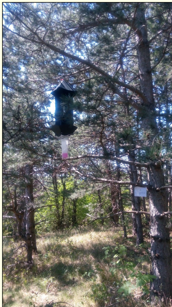
Slika 2: Križna past, ki jo uporabljamo za lovljenje neevropskih vrst kozličkov iz rodu Monochamus . Zbirna posoda je zatesnjena in napolnjena s konzervansom (npr. antifrizom). Enaka past se uporablja tudi za ulov vektorjev borove ogorčice, t.j. hroščev iz rodu Monochamus , z razliko, da je gre pri slednjem za suhi ulov, t.j. zbirna posoda je prazna in je omogočen odtok vode. Past je opremljena z obvestilom, ki vsebuje informacijo o namenu postavitve, kontaktnimi podatki odgovorne osebe in logotipom GIS

tipa Theysohn, opremljene z ustreznimi feromoni in kairomoni (Tomowit, Sexowit ter mešanica etanola in \alpha -pinena). Kontrolne pasti postavimo v bližino borovih sestojev in jih praznimo vsakih 14 dni. Pri odvzemu vzorca moramo delo opravljati sterilno. Ulov s pomočjo sterilnega čopiča stremo v sterilni lonček, ki ga opremimo z uradno nalepko. Vzorce v čim krajšem času dostavimo v LVG, kjer jih shranimo v zamrzovalnik do izvedbe analize.