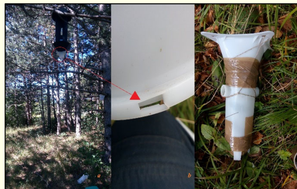
Slika 4: Polomljeni nosilci zbirne posode so lahko posledica vandalizma in/ali naravnih dejavnikov (a, b). Lepilni trak in vrvica sta ključna za uspešno improvizacijo na terenu (c)