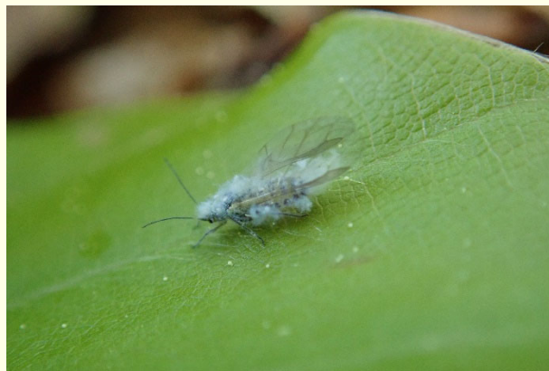
Slika 4: Bukova listna uš – krilati osebek.