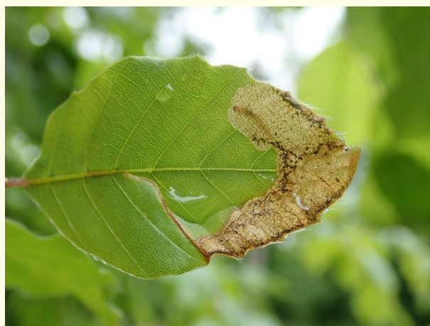
Slika 2: Značilna poškodba na listu bukve – v rovu je prisotna ličinka bukovega rilčkarja skakača.