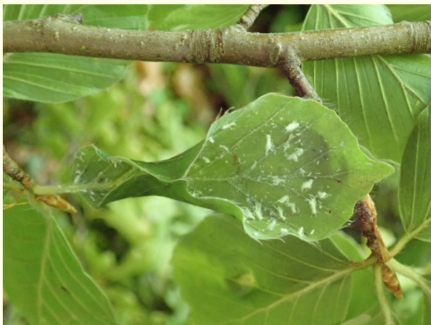
Slika 3: Bukova listna uš na listu bukve.