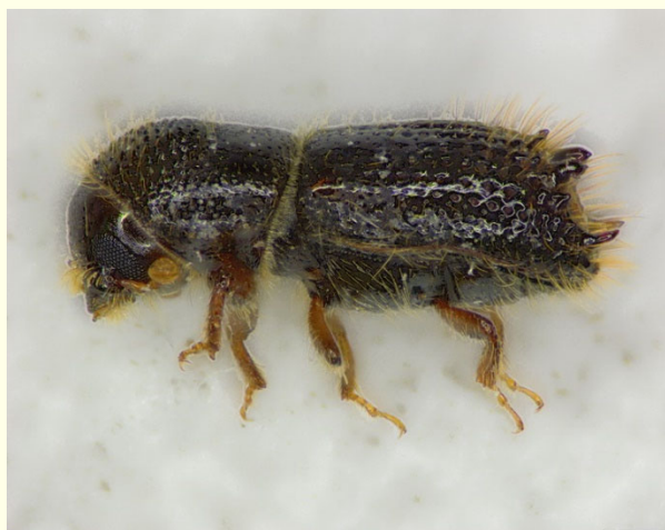
Slika 1: Vorontzowov vejni lubadar ( Pityokteines vorontzowi )