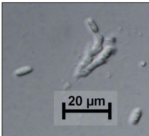
Slika 3: Trosonosci s konidiji glive Meria laricis