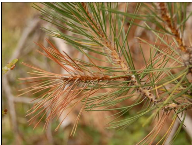
Slika 3: Ne tipičen simptom, ki ga je povzročila gliva Diplodia pinea na območju Podgorja na Krasu v letu 2008 - odmiranje najmlajših borovih poganjkov z dokončno zraslimi iglicami (pri tej bolezni navadno iglice niso dokončno zrasle)