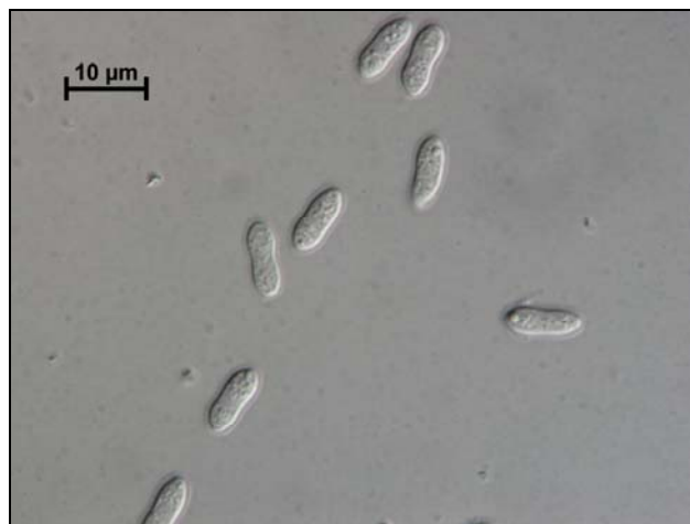
Slika 4: Brezbarvni konidiji glive Meria laricis