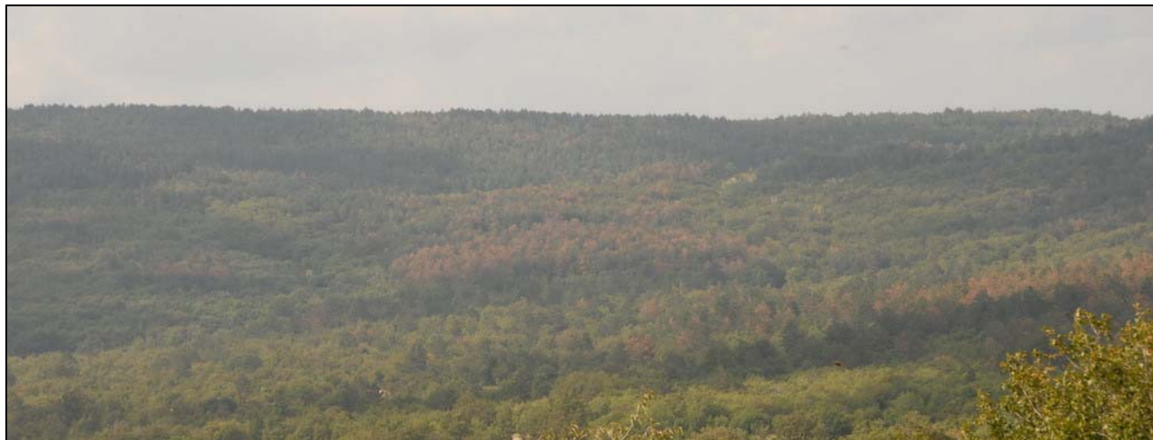
Slika 1: Veliko površinsko odmiranje črnega bora pri Podgorju na Krasu

1 Gozdarski inštitut Slovenije, Večna pot 2, 1000 Ljubljana; 2 Zavod za gozdove Slovenije, Območna enota Sežana, Partizanska 49, 6210 Sežana *nikica.ogris@gozdis.si