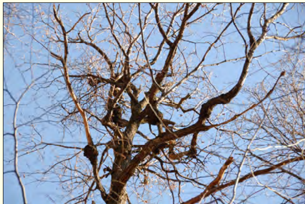
Slika 1: Posamezno drevo gradna je imelo tudi več kot 10 grmov navadnega ohmelja.

V opisanih razmerah obstajajo za izboljšanje stanja le gozdnogojitveni in gozdnogospodarski ukrepi. V prizadetem sestoju je potrebno dolgoročno zmanjšati delež gradna in ga nadomestiti s primernimi drevesnimi vrstami, ki so prilagojene na suha in topla rastišča: npr.