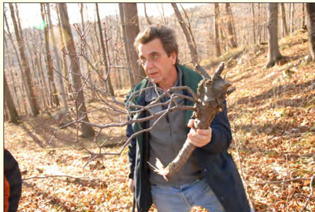
Slika 2: Grmi navadnega ohmelja so imeli premer do 1 m. Na mestu, kjer so je navadno ohmelje izraščalo, je bila veja odebeljena.

1 Gozdarski inštitut Slovenije, Večna pot 2, 1000 Ljubljana; 2 Zavod za gozdove Slovenije, Območna enota Ljubljana, Tržaška cesta 2, 1000 Ljubljana; 3 Zavod za gozdove Slovenije, Krajevna enota Zagorje, Ul. 9. avgusta 78/a, 1410 Zagorje ob Savi *nikica.ogris@gozdis.si