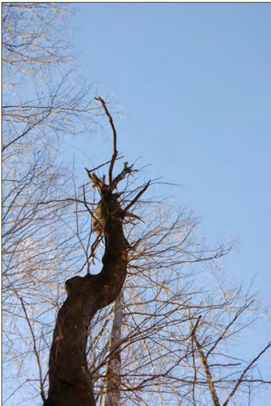
Slika 3: Na mestu, kjer izrašča grm navadnega ohmelja, se veja pogosto odlomi. Posledice so za drevo lahko tako drastične, da lahko ostane skoraj brez vej.