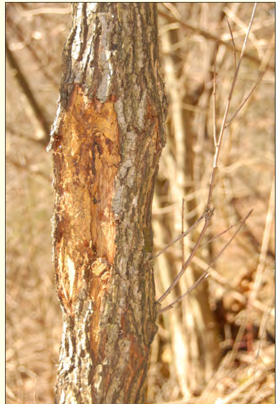
Slika 4: Gradjen je okužila gliva Chryphonectria parasitica , ki povzroča kostanjev rak.