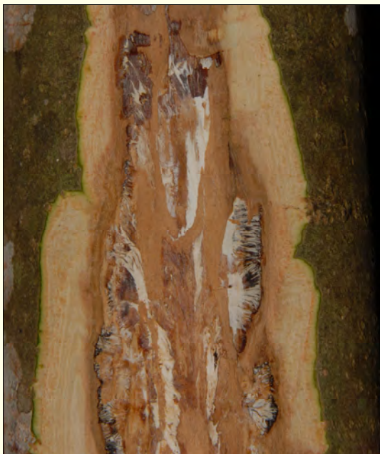
Slika 1: V skorji korenčnika velikega jesena se je razraščalo podgobje mraznice.