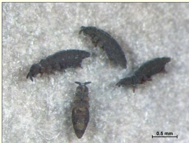
Slika 2. Snežni skakači – od spodaj in od strani.