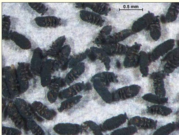
Slika 1. Posušeni snežni skakači iz Tebra nad Črno na Koroškem.

1 Gozdarski inštitut Slovenije, Večna pot 2, 1000 Ljubljana; 2 Univerza v Ljubljani, Biotehniška fakulteta, Oddelek za gozdarstvo in obnovljive gozdne vire, Večna pot 83, 1000 Ljubljana; 3 Zavod za gozdove Slovenije, Območna enota Slovenj Gradec, Vorančev trg 1, 2380 Slovenj Gradec * dusan.jurc@gozdis.si