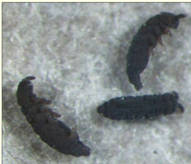
Slika 3. Na zadku skakača (levo spodaj) so dobro opazne skakalne vilice (furka).