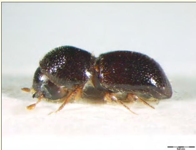
Slika 5. Xylosandrus germanus