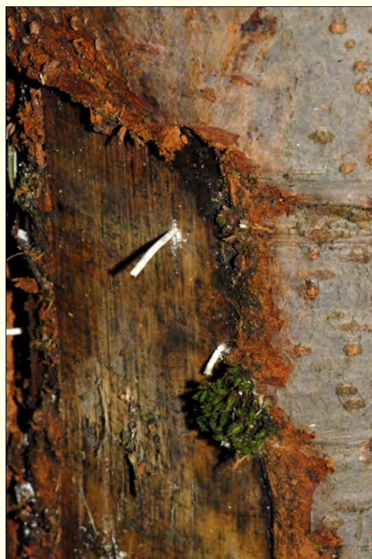
Slika 4. Črvina iz vhodne odprtine v obliki palčk je značilna za napad X. germanus