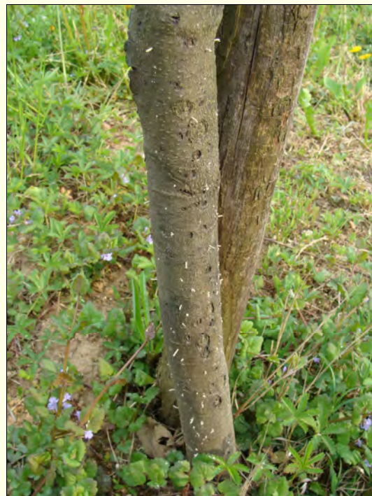
Slika 2. Napad Xylosandrus germanus na lokaciji Ajševica pri Novi Gorici maja 2010, kjer je povzročil sušenje drevja