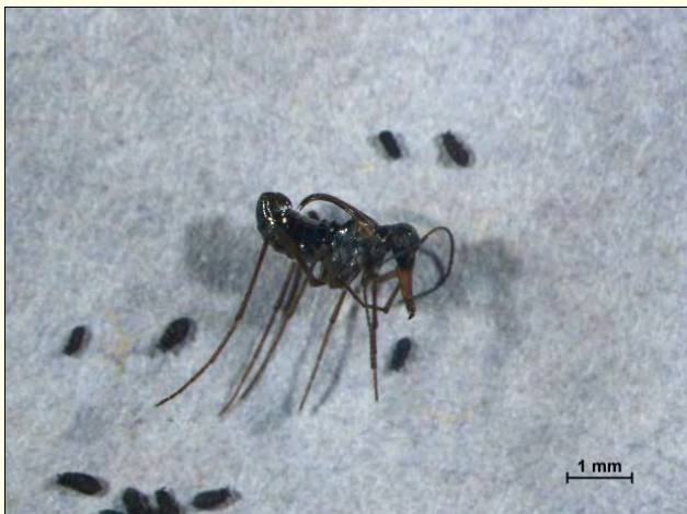
Slika 5. Snežna bolha in skakači.