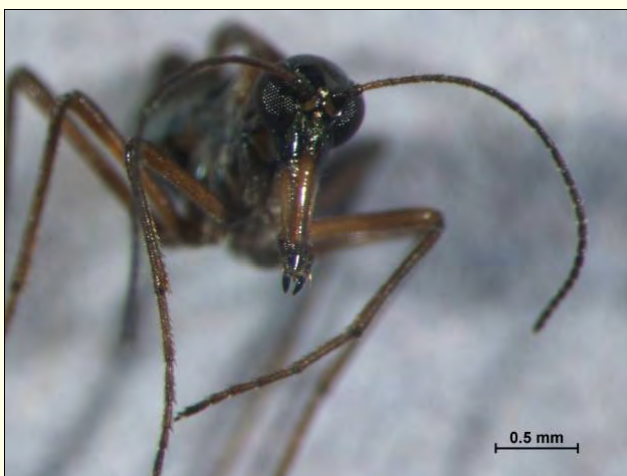
Slika 7. Glava snežne bolhe je podaljšana v rostrum in na koncu je grizalo.