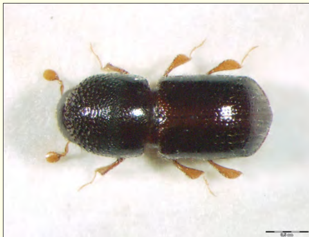
Slika 6. Xylosandrus germanus