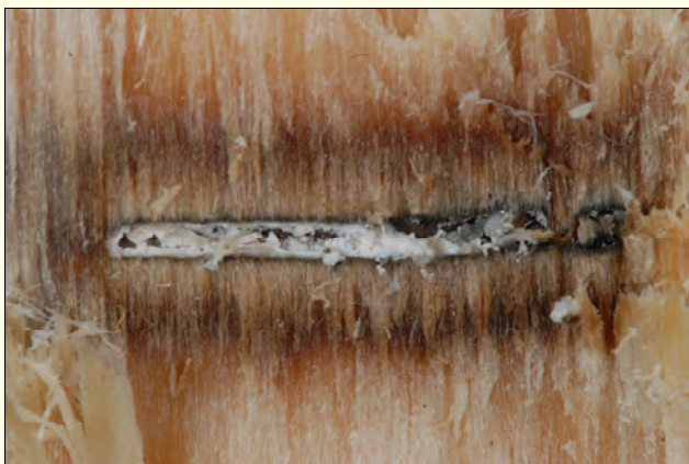
Slika 7. Xylosandrus germanus živi v povezavi z ambrozijskimi glivami, ki obarvajo in razgrajujejo les, v rovu so jajčeca