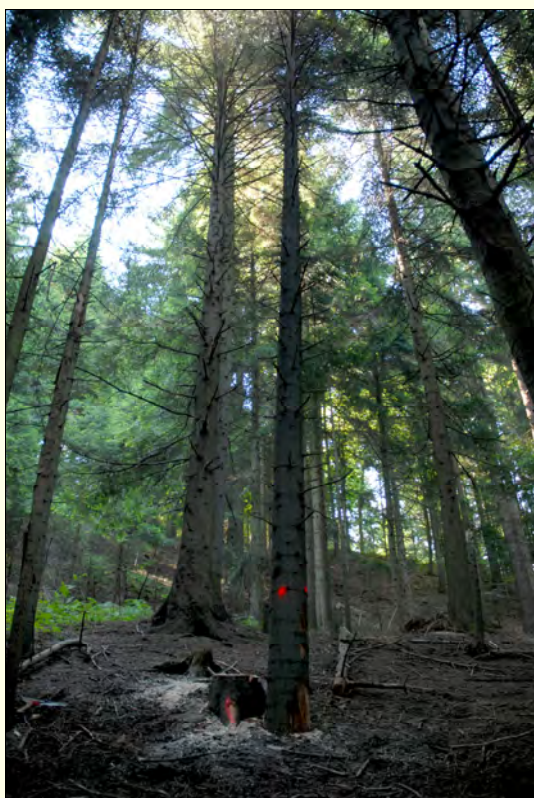
Slika 3. Napad Xylosandrus germanus na deblu jelke, 31. 5. 2009, lokacija Bevke, Mali plac