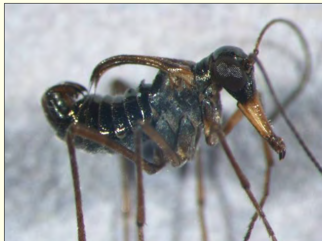
Slika 6. Samec snežne bolhe ima na hrbtni strani reducirana kri-la.