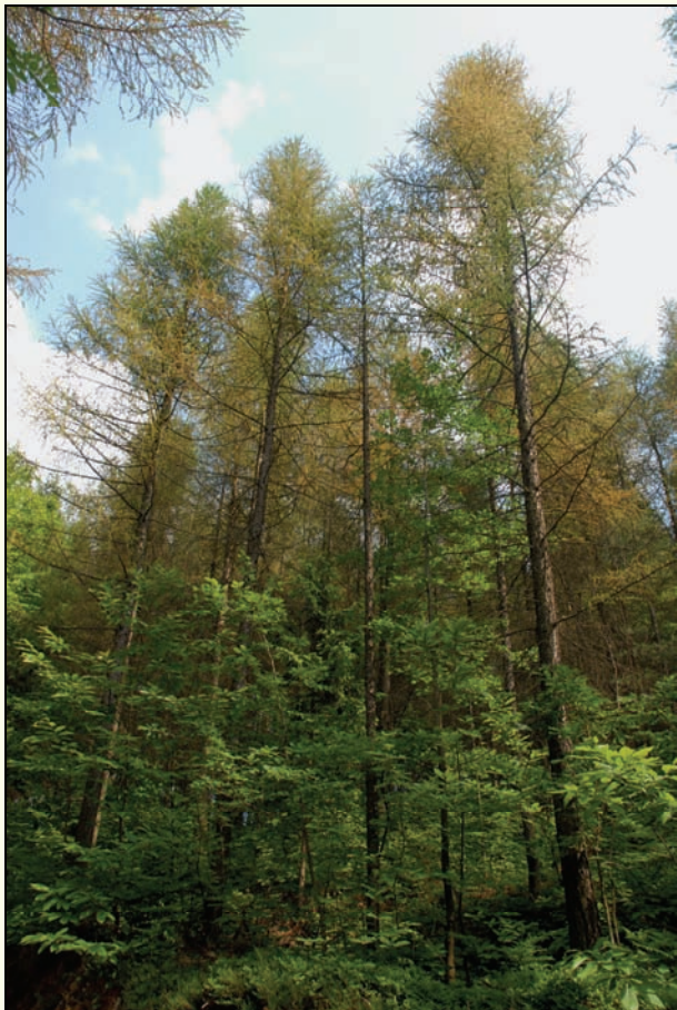
Slika 1: Defoliacijo in rjavenje japonskega macesna v KE Litija je povzročil molj macesnovih iglic ( Coleophora laricella), 26. 5. 2011