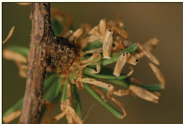
Slika 4: Na enem kratkem poganjku je več mešičkov, ki so dolgi 4 mm in so odprti z obeh strani, iglice imajo značilne izžrtine