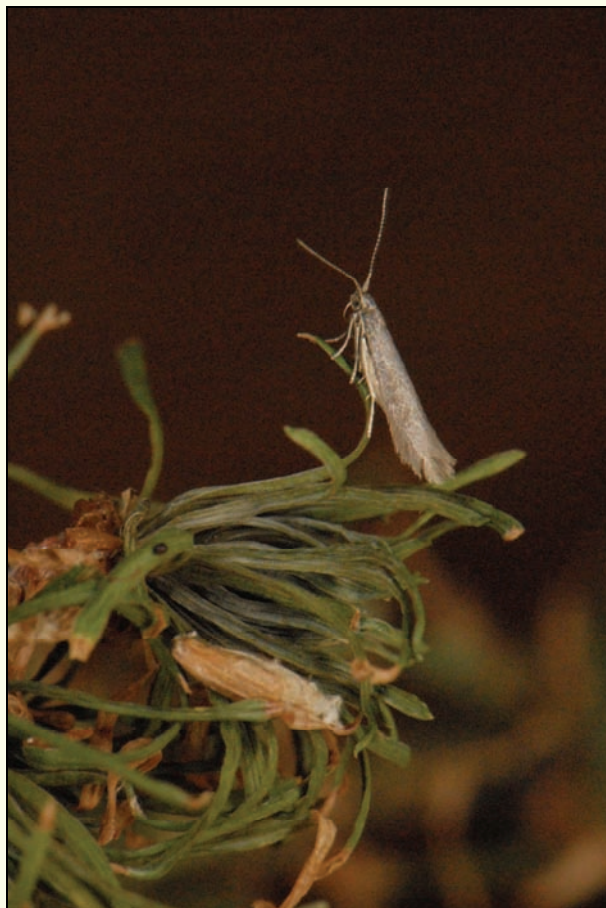
Slika 3: Macesnov molj in mešiček v katerem se je razvil