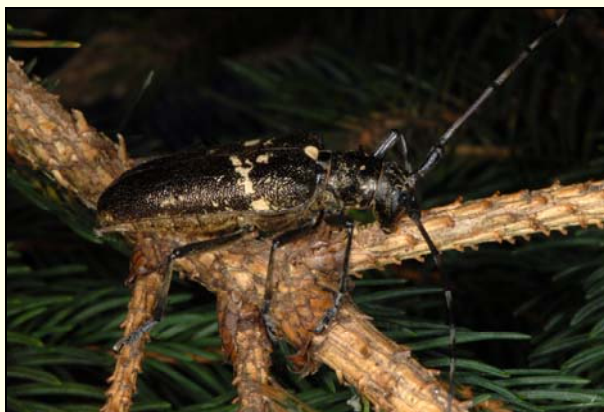
Slika 3: Monochamus sartor (Fabricius, 1787) – krojaški žagovinar