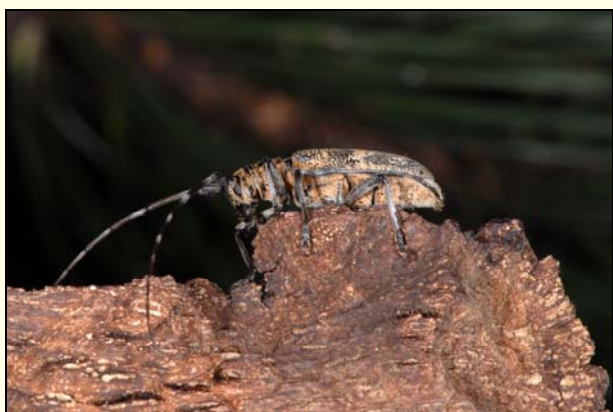
Slika 2: Monochamus galloprovincialis (Olivier, 1795) – borov žagovinar