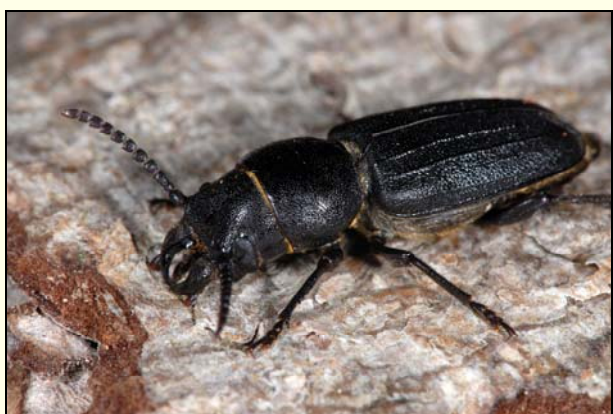
Slika 4: Spondylis buprestoides (Linnaeus, 1758) – gozdni kozliček