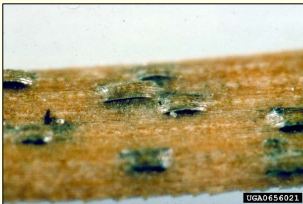
Slika 6: Trošišča glive Lecanosticta acicola na borovih iglicah