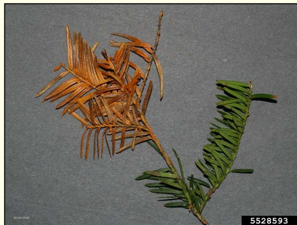
Slika 3: Odmrle iglice navadne tise in črna trosišča glive Cryptocline taxicola