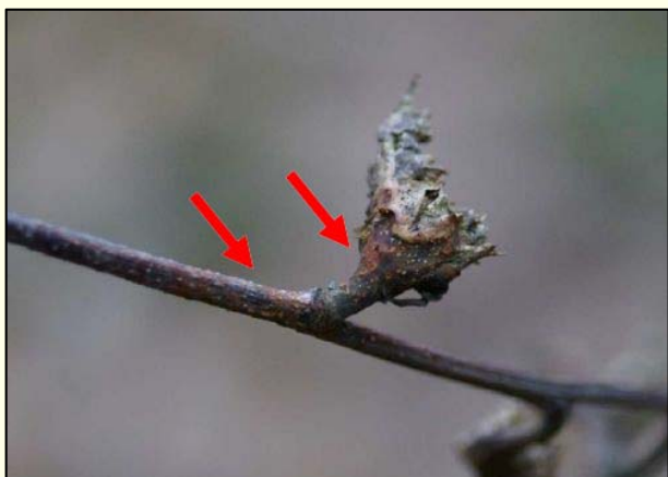
Slika 8: Odmiranje skorje zaradi glive Cryphonectria parasitica , ki je okužila vejico skozi šiško (Prospero in Forster, 2011)