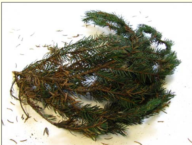
Slika 1: Simptomi na veji smreke, Picea abies – rjavenje, sušenje in odpadanje iglic.