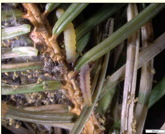
Slika 3: Gosenica metulja Epinotia tedella .