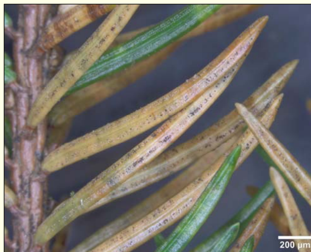
Slika 6: Rjavenje smrekovih iglic, ki ga je povzročila gliva Rhizosphaera pini