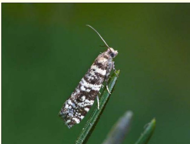
Slika 5: Odrasel osebek smrekovega zavijača.