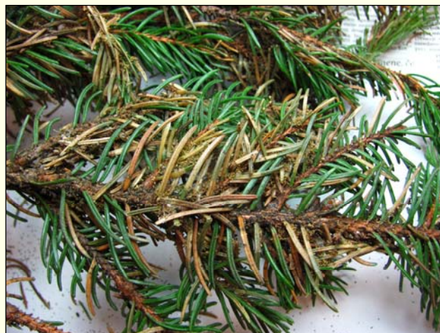
Slika 2: Spremembe na iglicah – rjavenje iglic, sprijemanje iglic, črvina med iglicami, na iglicah so prisotne ovalne odprtine.