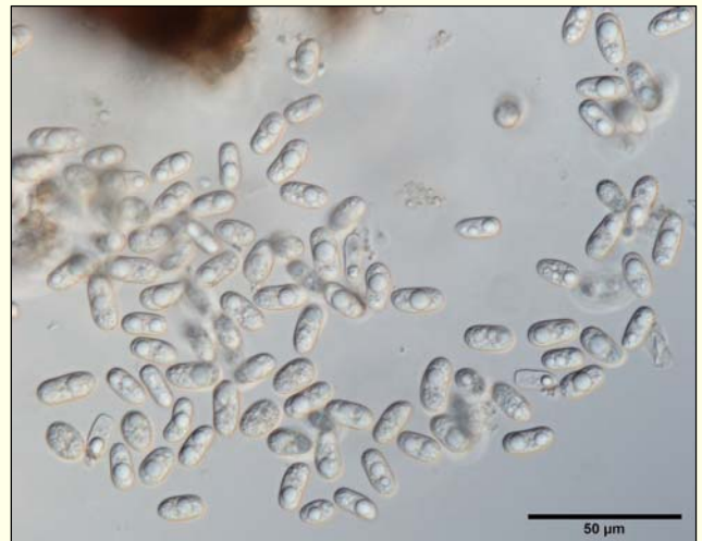
Slika 8: Ovalni, brezbarvni konidiji glive Rhizosphaera pini