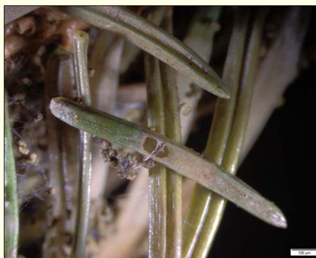
Slika 4: Poškodba na iglici – vhodna/izhodna odprtina.